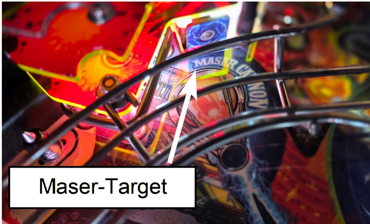
Maser-Target auf der linken mittleren Seite

Die Phasen: Erst schießt ihr auf die weißen Pfeile (Zielphase), dann auf das Maser-Target (Einrastphase), um die Schallwaffe zu aktivieren. Schließlich leuchtet der Schlagturm für 15 Sekunden für den Saucer Jackpot . Wenn der Timer abläuft, endet die Saucer Jackpot-Phase und die Zielphase beginnt von vorne. Jeder Saucer Jackpot fügt eine neue Kugel hinzu, sodass dieser Multiball eine ganze Weile laufen kann!